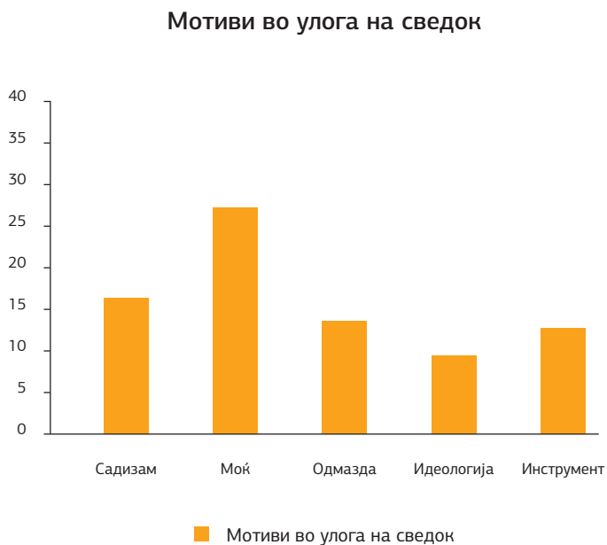
Графикон 5. Застапеност на мотиви кај средношколците кои се во улога на сведоци на насилни ситуации

Според графичкиот приказ погоре може да се забележи дека кога се во улога на сведок во насилните ситуации, средношколците најмногу мислат дека насилниците вршат насилство заради покажување моќ (34,43 %), садизам (20,66 %), потоа одмазда (17,06 %). Пониско застапени се инструменталните мотиви (15,87 %) и идеологијата (15,87 %).