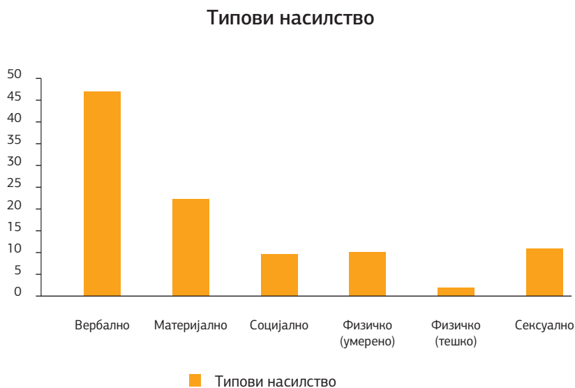
Графикон бр. 1 Процент на застапеност на различните типови насилство кај средношколците кои имале некакво искуство со насилство

Како што може да се забележи во графичкиот приказ погоре, највисоки резултати се добиени за вербалниот тип насилство или 45,91 %. Потоа е материјалното насилство ( M = 1,37 ) или 21,54 % од вкупно прикажаното насилство. Останатите видови се застапени во помал процент (социјално – 10,22 %, физичко умерено – 10,06 %, физичко тешко – 1,57 % и сексуално – 10,69 %).