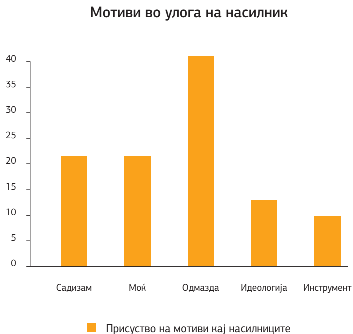
Графикон 2. Застапеност на различните типови мотиви кај средношколците во улога на насилници

Според резултатите од графичкиот приказ погоре може да се забележи дека најчести мотиви кај насилниците се мотивите за одмазда (39,8 %), потоа мотивите за покажување моќ (19,9 %) и садизам (19,9 %) и на крај идеологијата (11,65 %) и инструменталниот мотив (8,75 %).