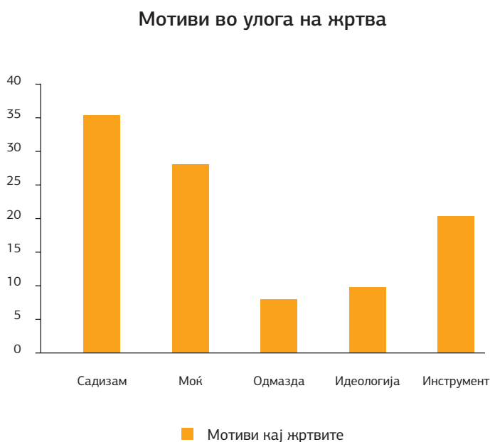
Графикон 3. Застапеност на различните типови мотиви кај средношколците во улога на жртви

Според графичкиот приказ погоре може да се забележи дека од аспект на жртва во насилните ситуации, средношколците најмногу мислат дека насилниците вршат насилство заради садизам (34,77 %), покажување на моќ (27,87%), потоа инструменталните мотиви (20,12 %). Значително пониски се мотивите за идеологија (9,48 %) и одмазда (7,76 %).